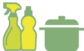
PULIZIA IN CUCINA