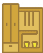
PULIZIA DEI MOBILI